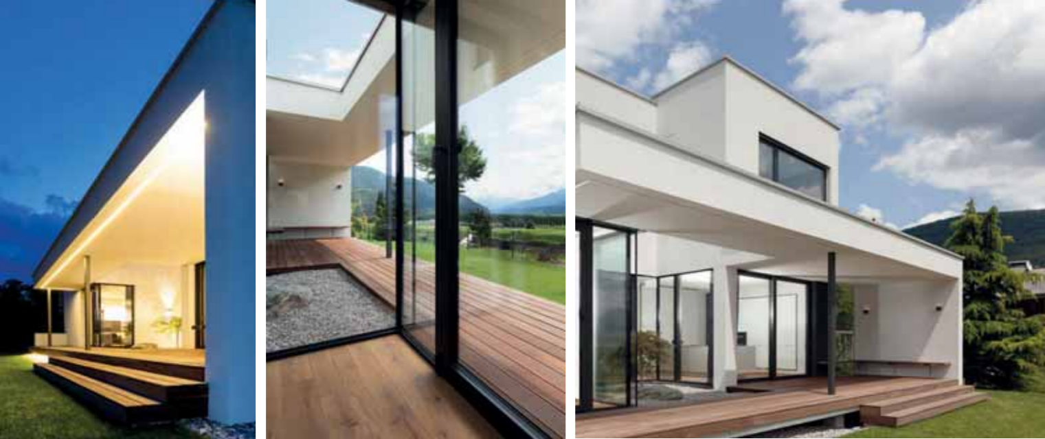
Der Übergang von Natur und Raum wurde hinreißend gelöst. Perfekte Elektroinstallationen der Firma Leitstrom unterstützen die faszinierenden Details.