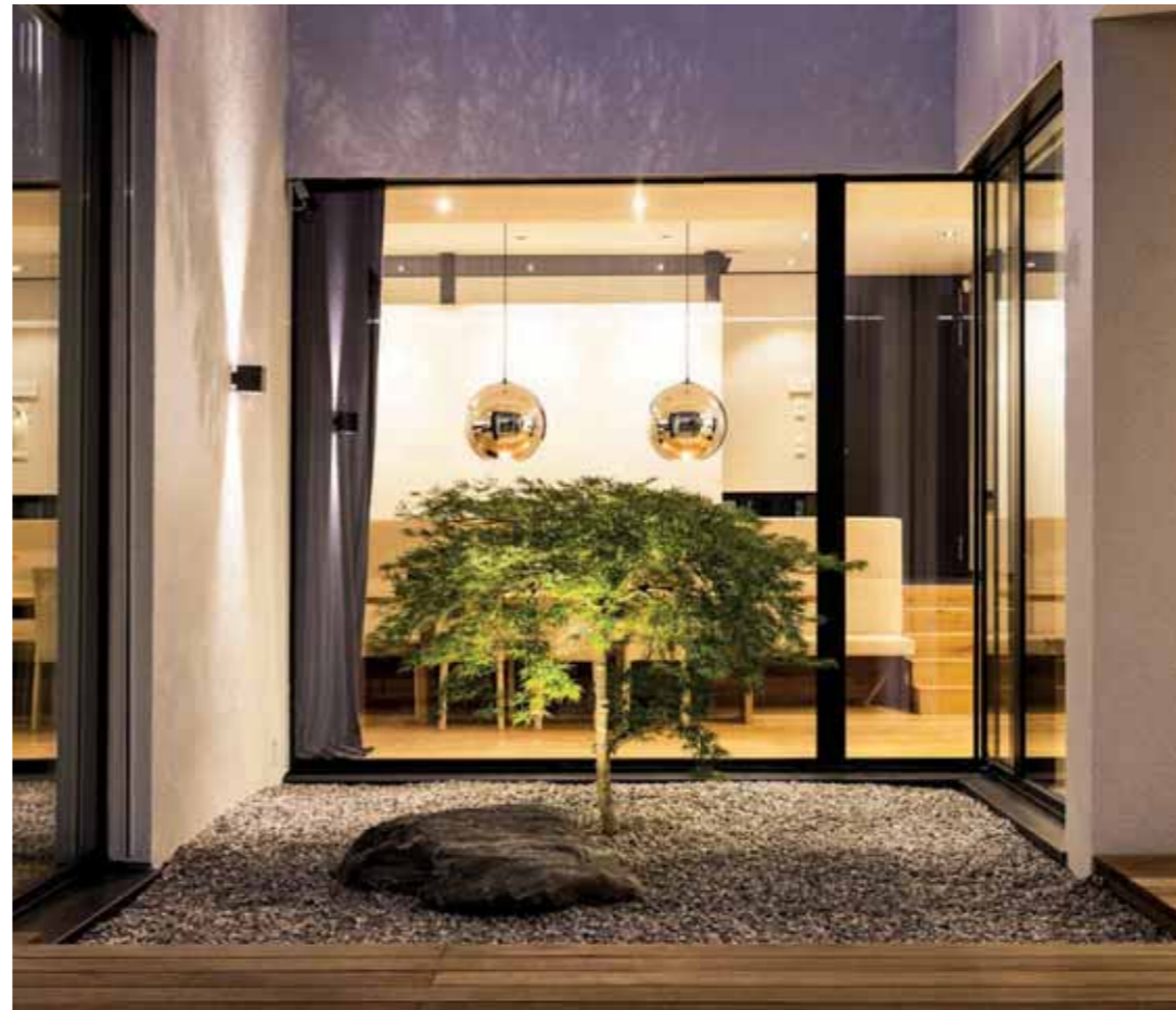
Eleganz und Effizienz gehen bei diesem Haus Hand in Hand. Für die Haustechnik und das Sanitäre zeichnet das Team der Firma Installationen Kratzer/Rietz verantwortlich.