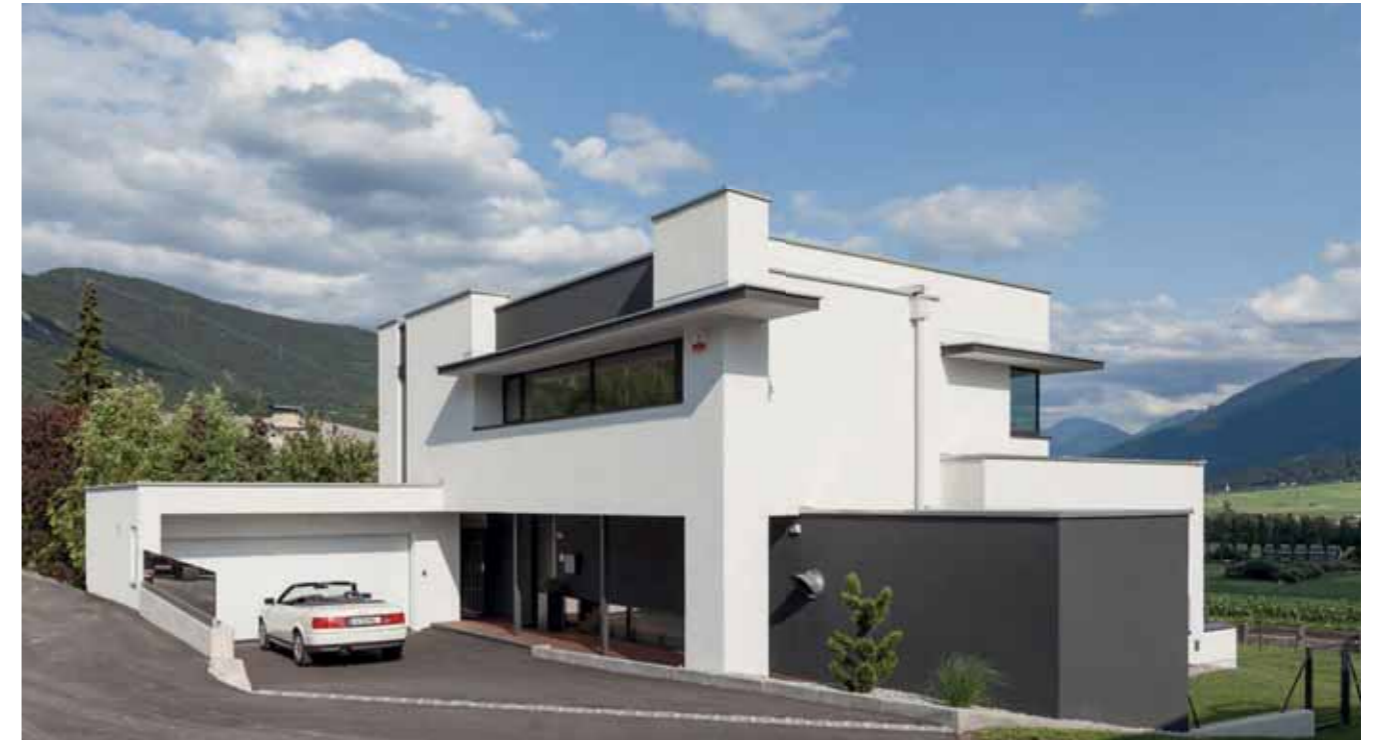
Von allen Seiten interessant und von oben geschützt durch ein langlebiges, hochwertiges Flachdachsystem der Firma Bauder.

Immer wieder zieht es den Blick ins Freie. Auf allen drei Ebenen des von Melis+Melis architecten entworfenen Hauses in Telfs behalten Bewohner und Besucher die absolute Übersicht. „Wir wollten ein praktisches und energieeffizientes Haus“, sagen die Bauherren und erfreuen sich daran, dass das moderne Refugium so viele schöne Seiten hat.