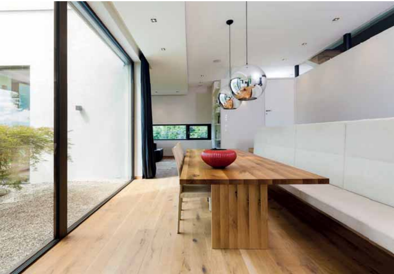
Offenes Wohnen im Erdgeschoss: Die Einbaumöbel und die Küche mit Kochinsel plante und realisierte Innenarchitekt Michael Leutgeb / Firma – Leutgeb innovativ design.