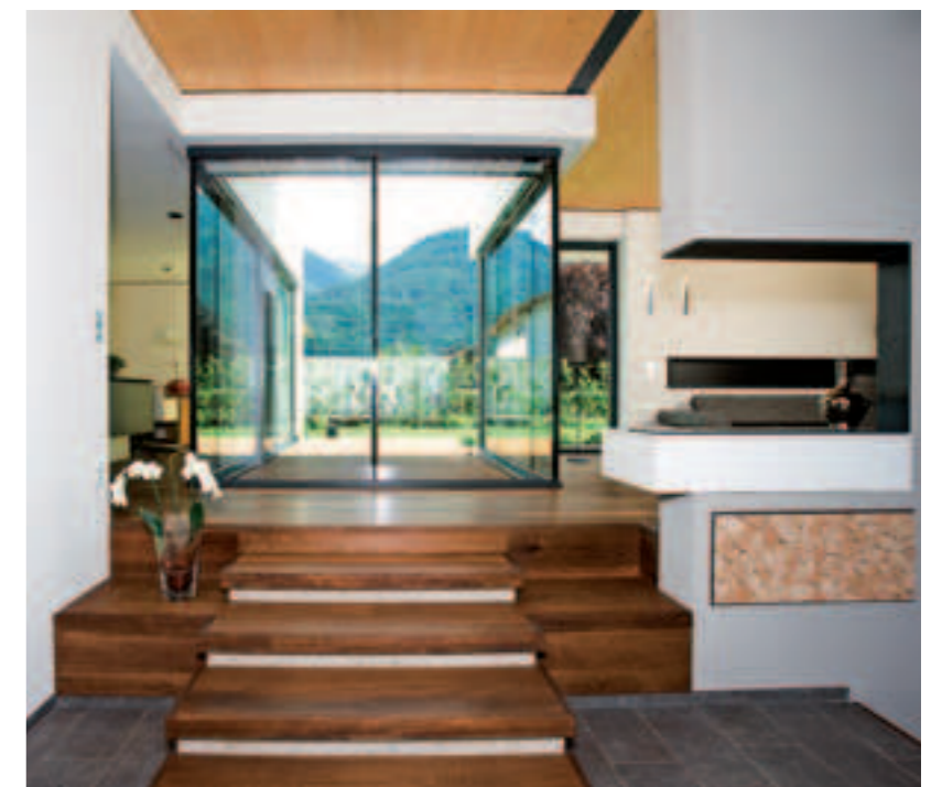
Eingangsbereich mit Glas-Atrium.