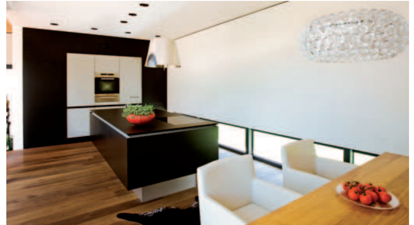
Gesamte Inneneinrichtung & Gestaltung: Wohndesign Freudling, Fügen.