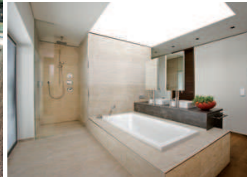
Bad mit Dachfenster: Die Sanitärinstallation und die komplette Haustechnik lieferte Installationstechnik Falkner & Eberharter.

Architekten werfen einen Blick auf das künftige Eigenheim und erkennen auf Anhieb die Schwachstellen, die dem Baupaar auch schon schlaflose Nächte bereitet hatten. Sie bieten den Unschlüssigen an, nach genauer Besprechung und Besichtigung des Bauplatzes einen völlig neuen Entwurf zu machen. Das war vor zwei Jahren, inzwischen wohnt die Familie in dem eleganten, energieeffizienten und dank der Atriumlösung atemberaubend offenen Haus von Melis + Melis. Und die Begeisterung ist groß. „Die hellen, unterschiedlich hohen Räume, das gesunde