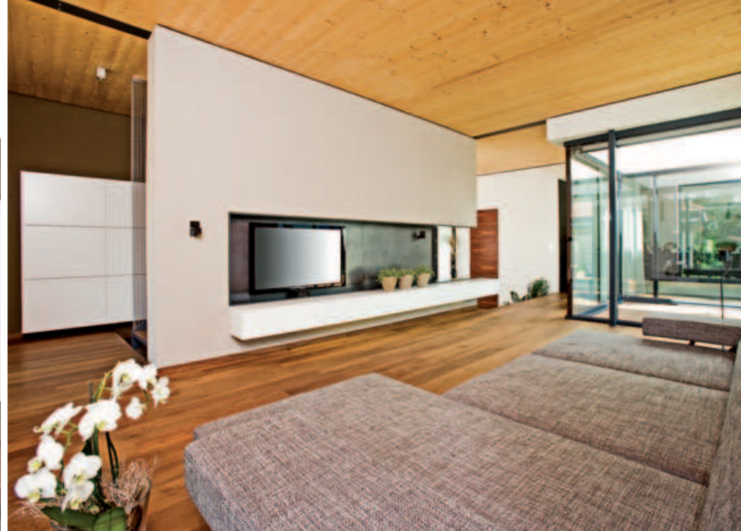
Raffinierte Einschnitte in den Wänden wirken fast organisch.