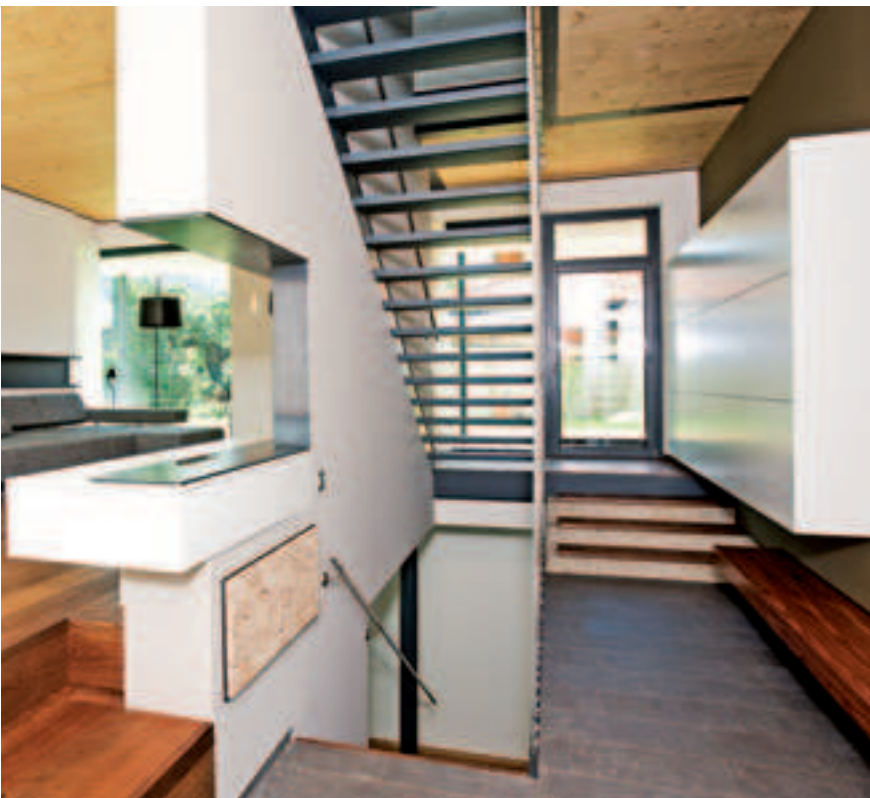
Das offen konzipierte Haus wurde mit individueller Wohnkeramik von Fliesen Jenwein (Innsbruck & Karres) und Eichenböden ausgeführt.